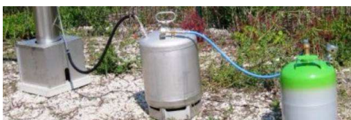
Un générateur anti-grêle installé en Bourgogne

Les vignerons du Beaujolais et de Bourgogne ont décidé d'équiper la quasi-intégralité de leurs surfaces de générateurs anti-grêle dès cette année. D'ici juin 2017, 143 générateurs seront déployés du sud-Beaujolais jusqu'à Chablis