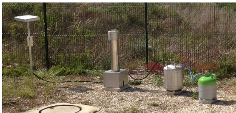
Générateur à installer sur 42 sites icaunais

Les générateurs anti grêle existent depuis 1954 et ont été développés par Airbus à Toulouse pour éviter que la grêle n'endommage les avions avant leur livraison.