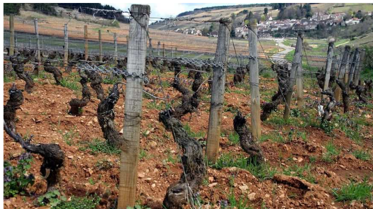
Vignoble de l'auxerrois

Le principe est d'installer des générateurs anti-grêles sur le passage des orages.